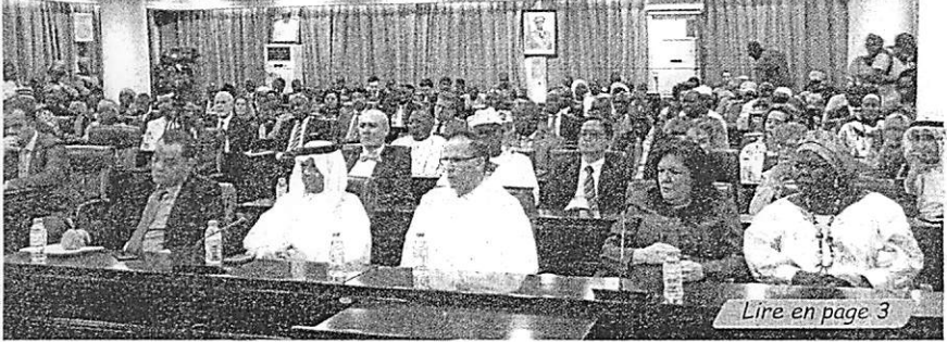
Lire en page 3