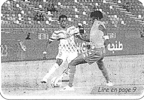
Lire en page 9