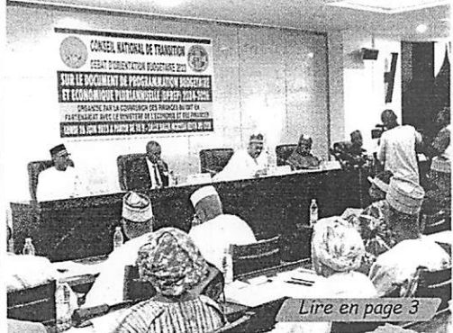
Lire en page 3