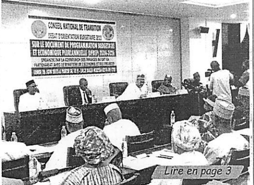
Lire en page 3