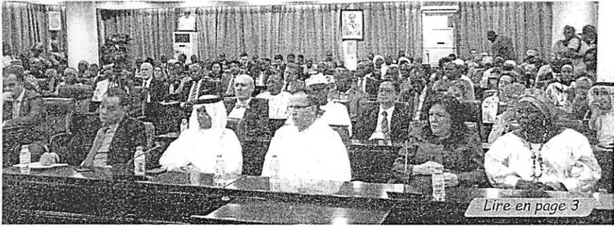
Lire en page 3