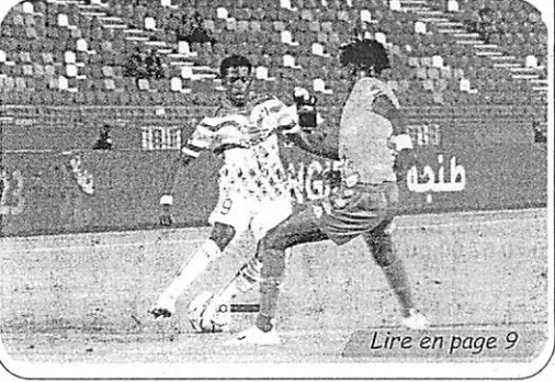
Lire en page 9