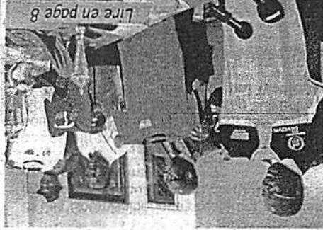
Lire en page 8