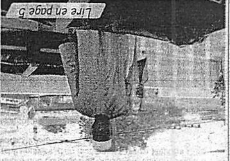
Lire en page 5