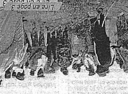
Lire en page 3